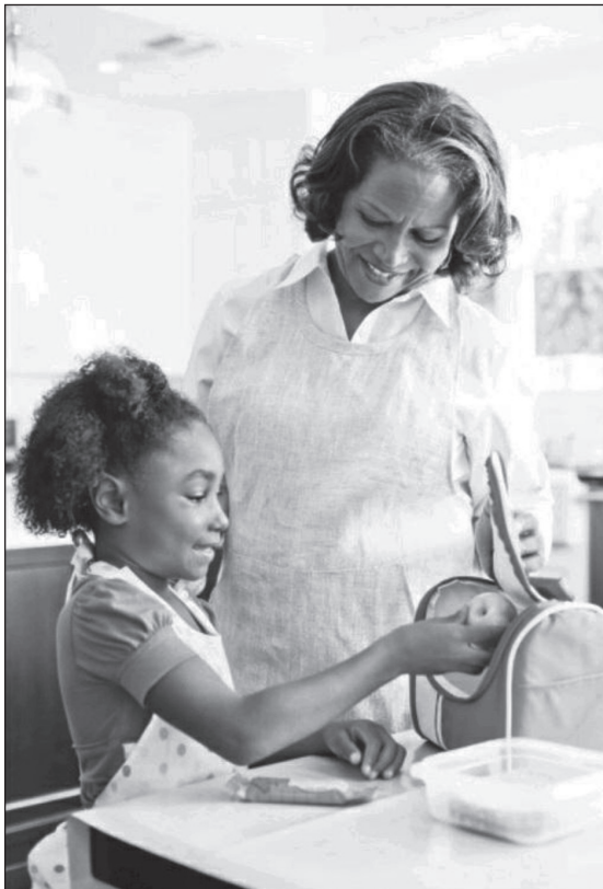
شش درصد کودکان با یک پدربزرگ و یا مادربزرگی زندگی می‌کنند که مراقب اصلی آنها است.

شکل ۲، درصد کودکانی که با پدربزرگ و مادربزرگ زندگی می‌کنند را با توجه به حضور یا عدم حضور والدین و نژاد- قومیت آنها نشان می‌دهد. خانوارهای نسل کاسته - خانوارهایی که در آنها نوه با پدربزرگ و مادربزرگ و بدون حضور یک والد زندگی می‌کند- در بین کودکان سفیدپوست (۲۴ درصد) و کودکان سیاه‌پوست (۲۸ درصد) رایج‌تر است؛ درحالی‌که این نسبت برای کودکان آسیایی‌تبار ۳ درصد، و کودکان لاتین‌تبار ۱۲ درصد است. بیشتر کودکان آسیایی که با پدربزرگ و مادربزرگ‌ها زندگی می‌کنند، همچنین در کنار هر دو والد خود هستند؛ درحالی‌که بیش‌ترین تعداد کودکان سیاه‌پوست و لاتین‌تبار با یک پدربزرگ یا مادربزرگ و مادرشان زندگی می‌کنند.