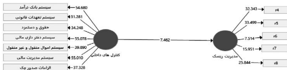
شکل ۲. مدل در حالت اعداد معناداری

همان طور که در شکل فوق مشخص است در سطح اطمینان ۹۵ درصد اعداد معناداری باید بیش از ۱/۹۶ محاسبه باشد تا فرضیه اصلی مورد تأیید قرار گرفته باشد. همان طور که اعداد معناداری مدل مشخص است. اثر کنترل داخلی بر مدیریت ریسک این متغیر مورد تأیید قرار می گیرد. همان طور که بیان شده، هدف اصلی این تحقیق بررسی اثربخشی کنترل داخلی بر مدیریت ریسک می باشد. نتایج بررسی هدف اصلی در جدول شماره ۶ بیان شده است.