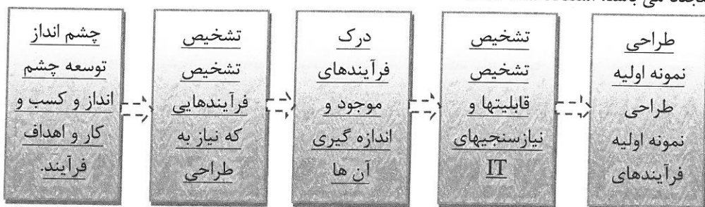
شکل ۶-۱ این متدولوژی را نمایش می دهد

در این تحقیق از متدولوژی داوونپورت ۱ و شورت ۲ که یکی از متدولوژی های موجود در بحث مهندسی مجدد می باشد، استفاده شده است.