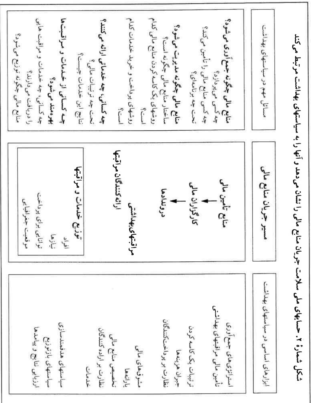
شکل شماره ۲. حسابهای ملی سلامت جریان منابع مالی را نشان می‌دهد و آنها را به سیاستهای بهداشتی مرتبط می‌کند