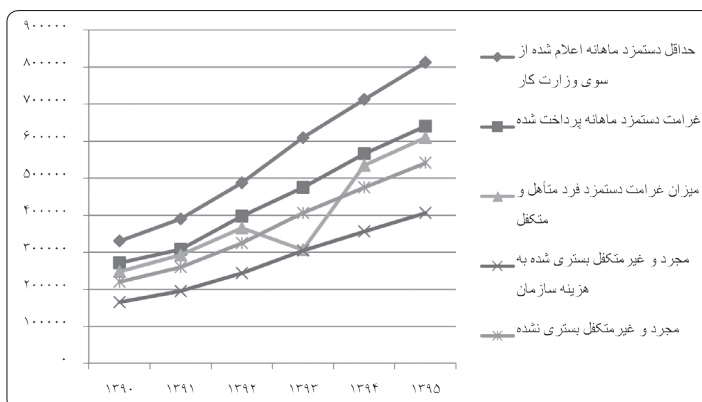
نمودار ۱: تغییرات غرامت دستمزد ایام بیماری و حداقل حقوق ماهیانه از سال ۱۳۹۰ تا ۱۳۹۵

منبع: دفتر آمار و محاسبات اقتصادی و اجتماعی (۱۳۹۱ - ۱۳۹۶) * ارقام این ردیف برگرفته از گزارش هزینه درآمد خانوار شهری مرکز آمار ایران (۱۳۹۶ - ۱۳۹۱) است.