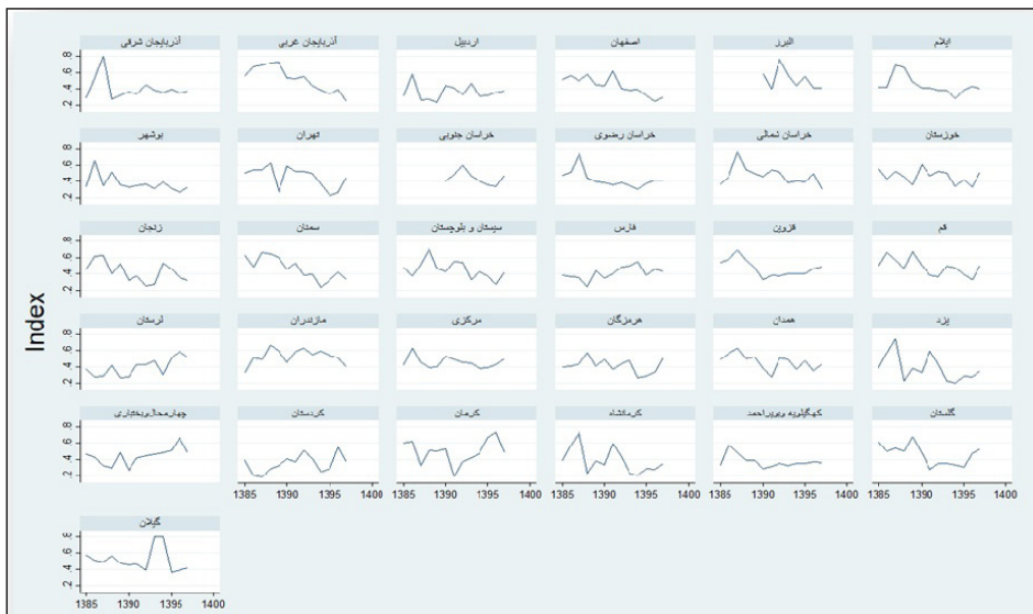
نمودار ۱. شاخص ترکیبی عدالت اقتصادی-اسلامی استان‌ها در دوره ۱۳۸۵-۱۳۹۷

نمودار (۱) روند تغییرات شاخص ترکیبی عدالت اقتصادی اندازه‌گیری شده در استان‌های مختلف را نشان می‌دهد.